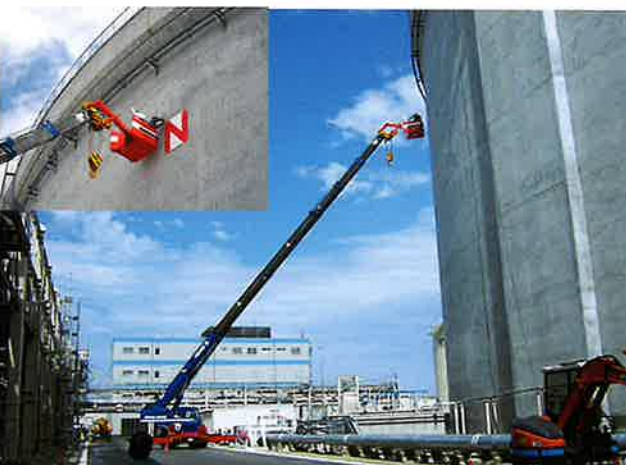
LNGタンク看板作業 半径25m 50Tラフター