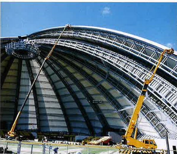
ドーム塗装 55m作業 50Tラフター