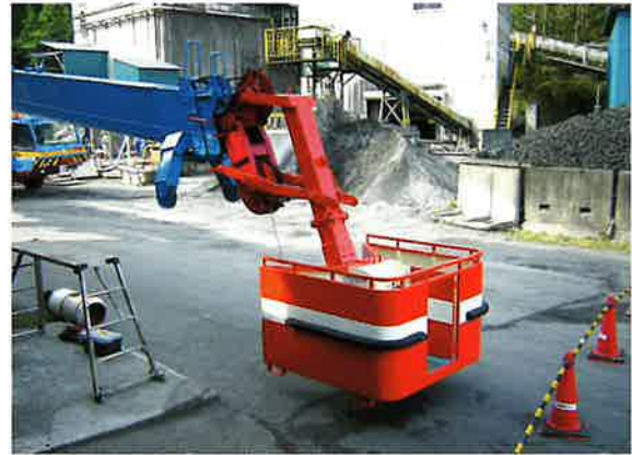
200T フルオートジブ取付

ボックスの外側は鋼板で囲い、高所における搭乗者の風よけと恐怖心を少なくしています