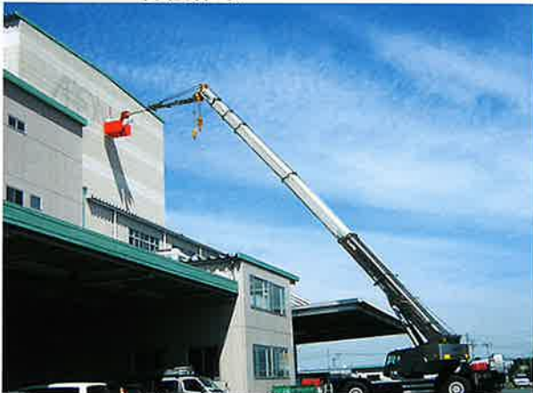
倉庫看板作業 半径30m 50Tラフター