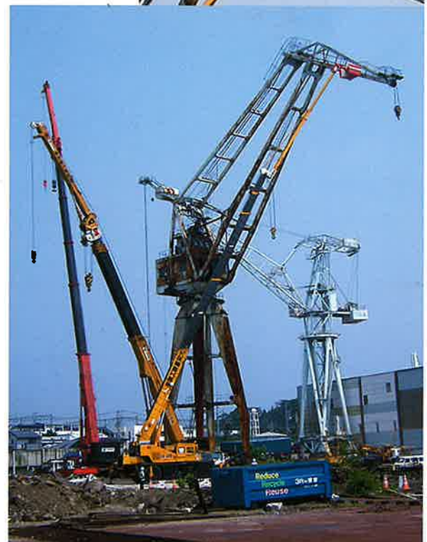
造船所クレーン解体 50m作業 50Tラフター