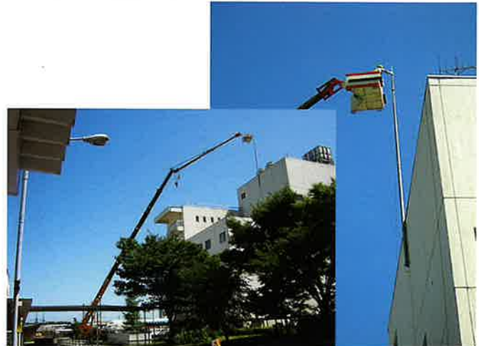
避雷針交換作業 半径30m 50Tラフター