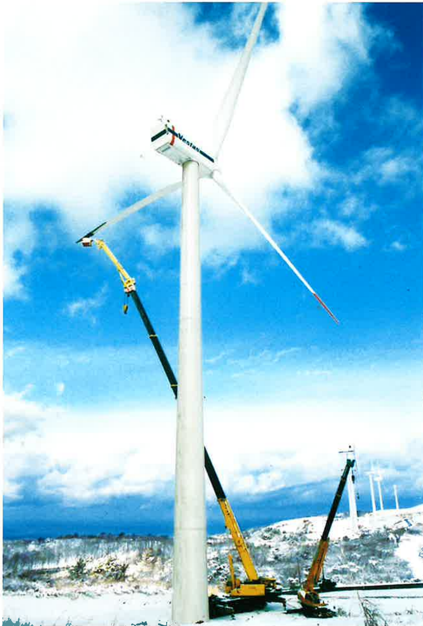
200Tフルオートジブ装着